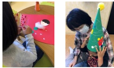
クリスマスのさんかくぼうし 「頭にぴったりだね」

保育室ではお子さんの年齢や興味、その日の病状に合わせて、季節の製作や遊べるおもちゃ作りを楽しんでいます。お迎え時、保護者の方に自慢げに見せたり照れて隠したり、それぞれの表情がとても可愛いです。