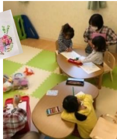
トンボのめがね「どんな色に見えるかなあ？」 「つぎはどのいろにしようかなあ～」