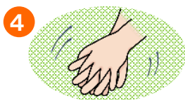
4 ゆびのあいだすりすり