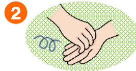
2 ゆびさきクルクル