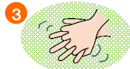
3 てのこうもみもみ