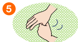
5 おやゆびクルクル